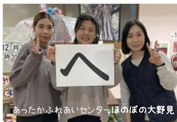
あったかふれあいセンターほのぼの大野見