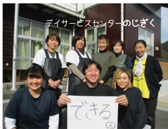
デイサービスセンターのじぎく